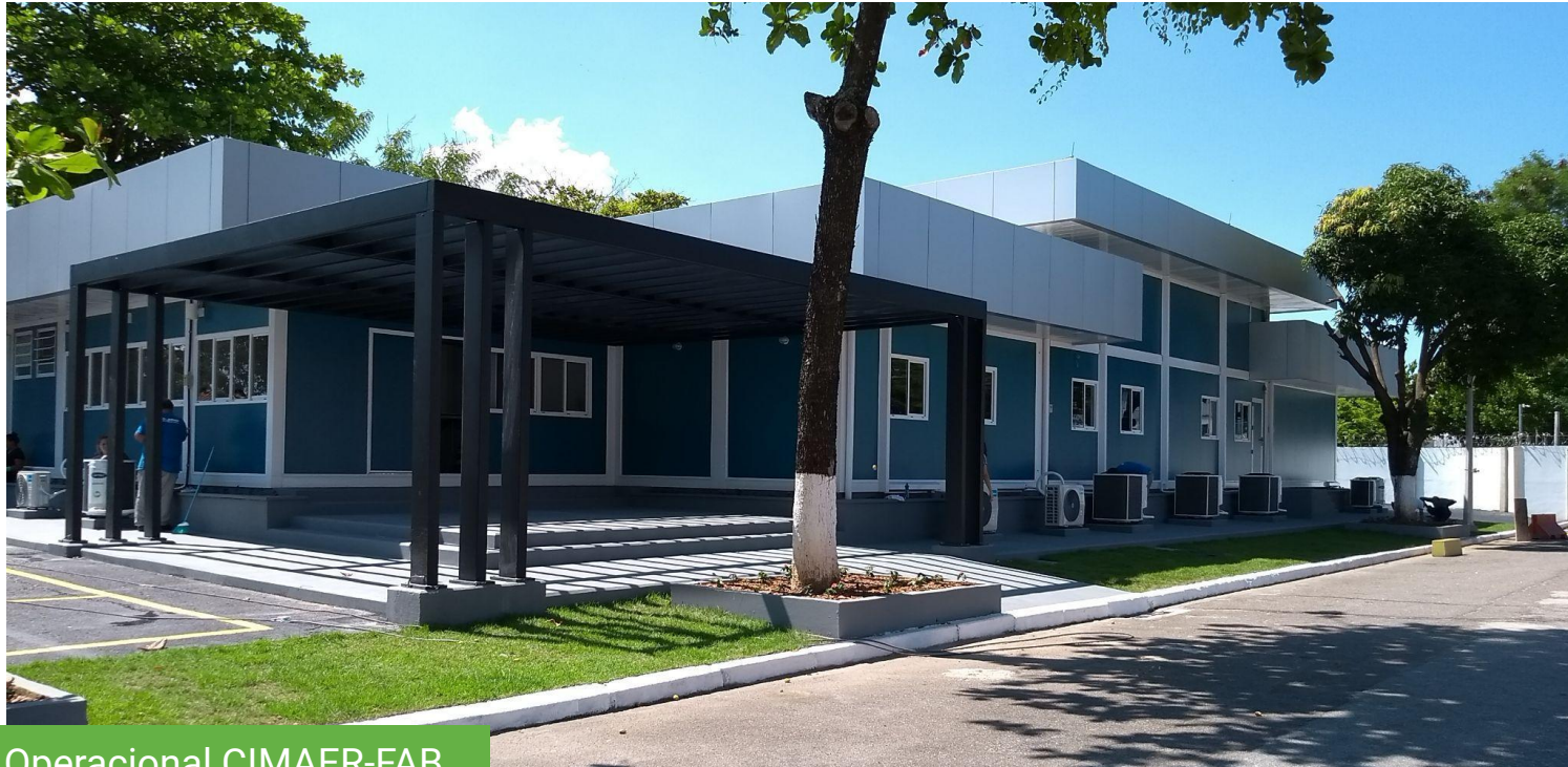
Base Operacional CIMAER-FAB