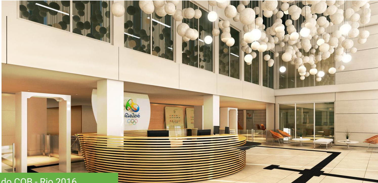
Sede do COB - Rio 2016