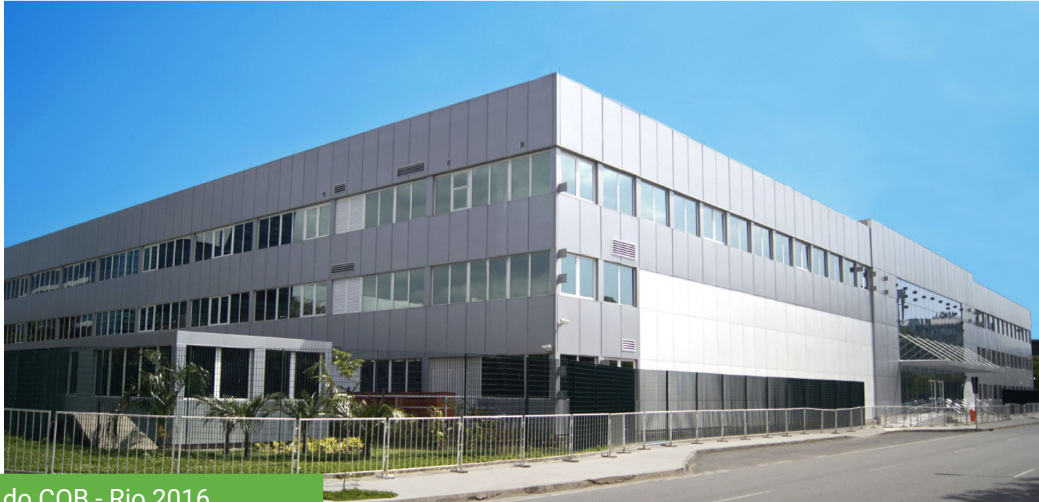
Sede do COB - Rio 2016