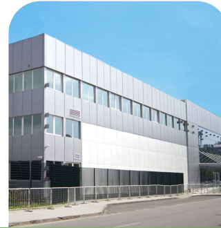
Inauguração da filial de Brasília.