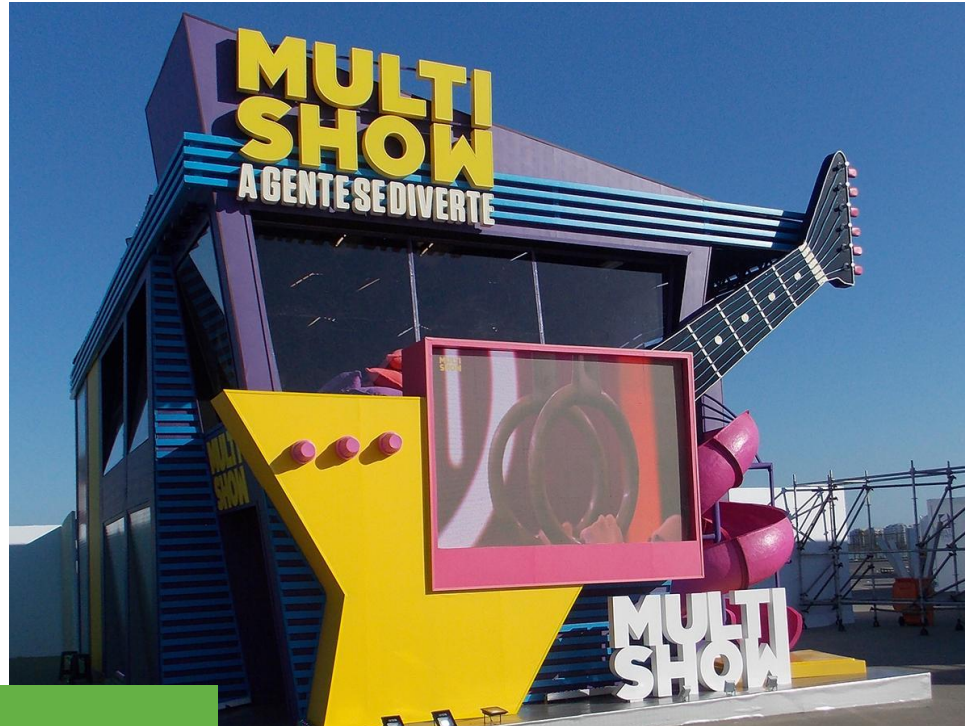
Rock in Rio