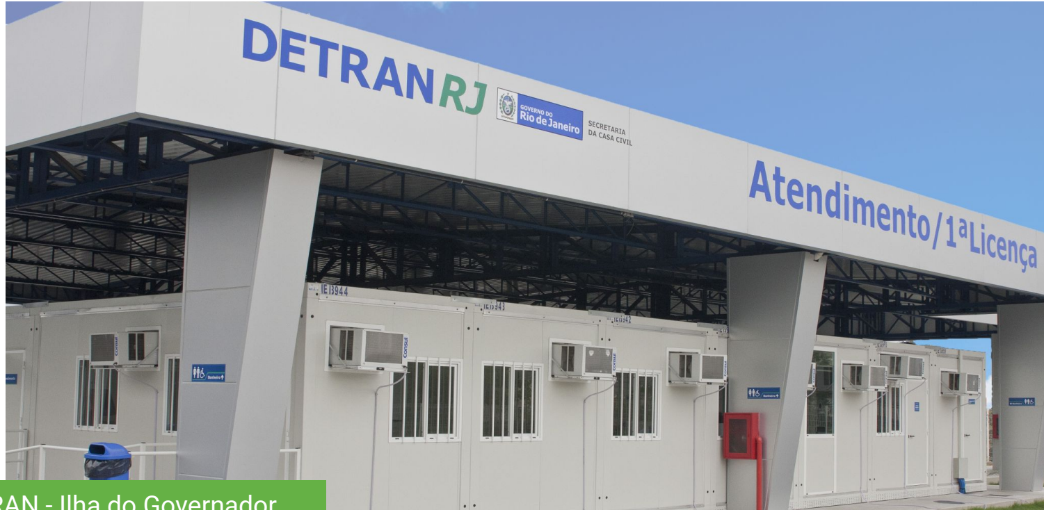
DETRAN - Ilha do Governador