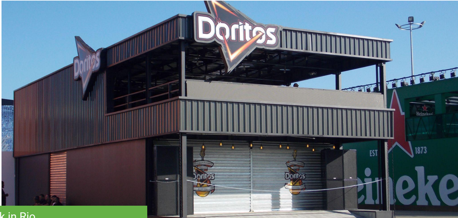
Rock in Rio