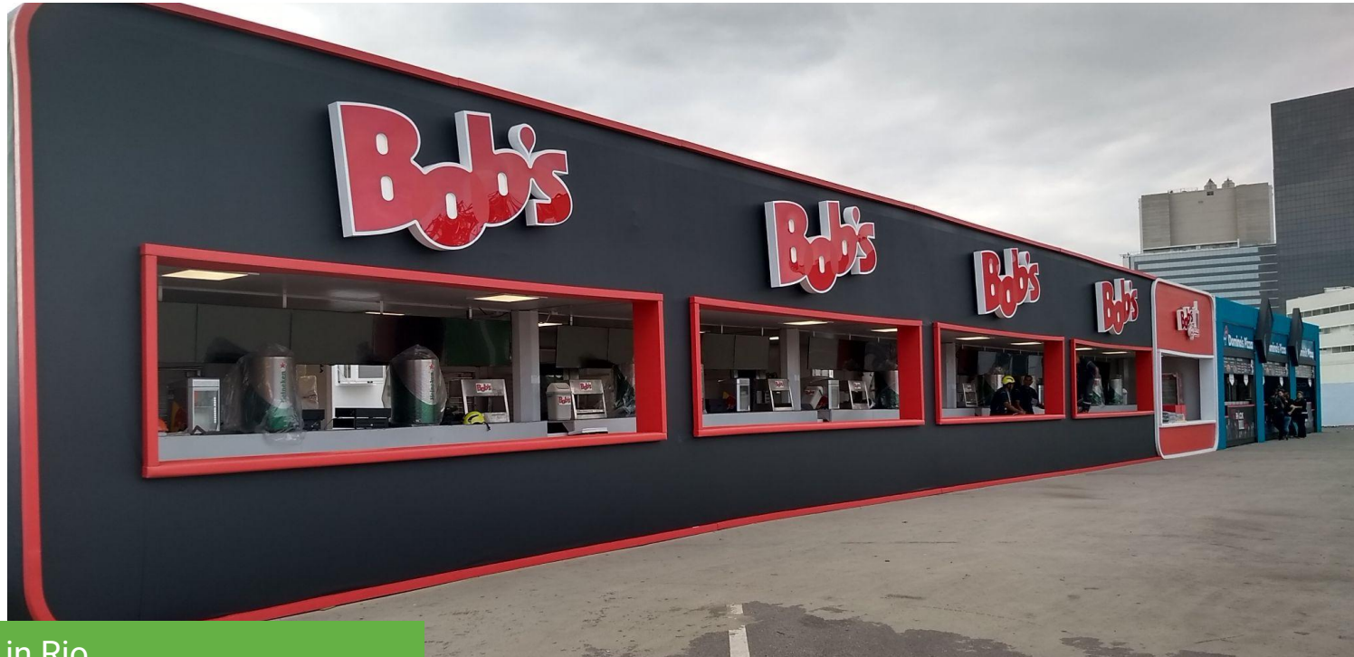
Rock in Rio