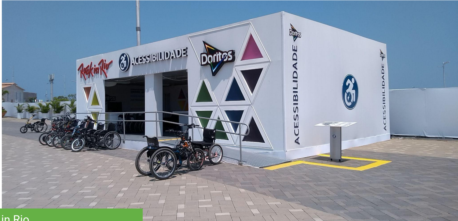
Rock in Rio